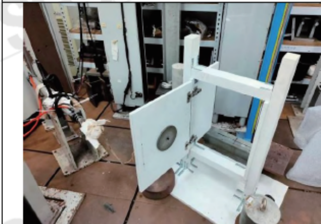
照片“C” 往復耐久性測試