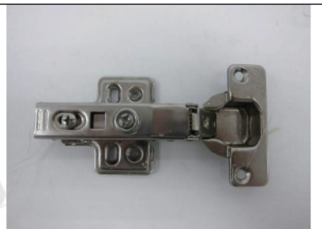
照片“B” 測試後樣品外觀- 48 hrs