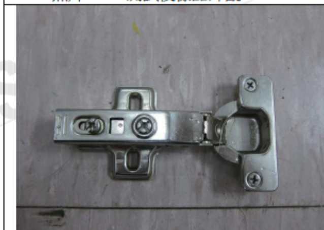
照片“E” 測試後樣品外觀- 192 hrs