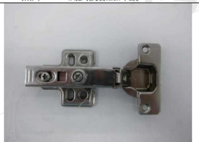
照片“F” 測試後樣品外觀- 240 hrs